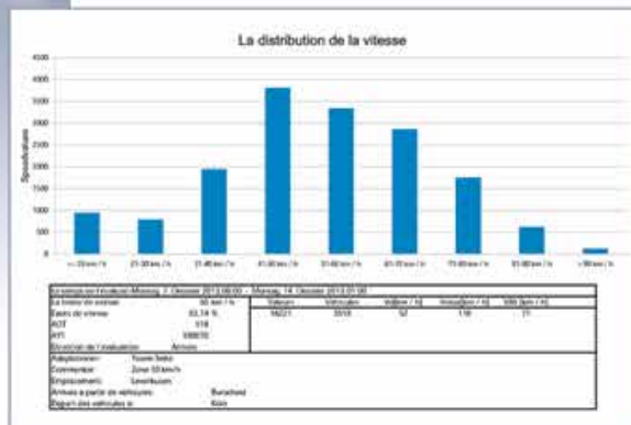
Exemple d'évaluation Trafficeck radar préventif