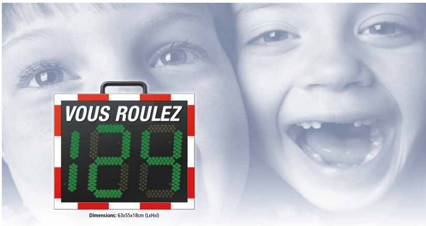
Dimensions: 63x55x18cm (LxHxl)